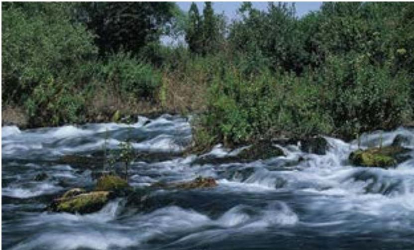
פלגי הדן.

מעיין הדן הוא אחד משלושת מקורות הירדן. מימיו של הנחל שופעים ויוצרים זרם עז, שוצף ורב רושם באפיק הראשי, ומתפלגים לשורה של פלגי מים משכשכים הבוראים יחדיו ארץ פלגי מים קטנה, שאין לה אח ורע בישראל השחונה; "ארץ", שלצידו של כל פלג ופלג בה מתקיים יער גדות מקסים ומוצל של עצי דולב, מילה, ערבה, שיחי קנה ופטל וצמחים רבים אחרים. זהו יער קסום שמקננות בו ציפורים, שזוהי נחלתן כפי שמי הנחל הם נחלתם של הדגים המקומיים ושאר יצורי המים.