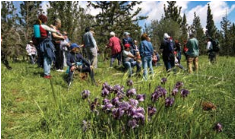
טיולי המחאה להצלת האיריסים בגלבוה.

היזממה לתוכנית ההקמה של יישוב חדש בשם מיכל בתוך שמורת טבע בהר הגלבוה החלה להתגלגל במוסדות התכנון בראשית שנות האלפיים. התוכנית הייתה להקים את היישוב דווקא בהר יצפור, בלב אחד הריכוזים העשירים והיפים של איריס הגלבוה הנדיר, המצוי בסכנת הכחדה, שהר הגלבוה הוא המקום היחיד בעולם שבו הוא צומח. לא בכדי נפתחת קינתו של דוד על המלך שאול ועל יהונתן בנו, שנפלו בקרב עם הפלישתים בגלבוה, במשפט "אל טל ואל מטר עליכם הרי בגלבוה". הגלבוה הוא ספר-מדבר, אזור שחון שמתקיים בו מפגש ייחודי של בעלי חיים וצמחים מהאזורים הטבעיים הים-תיכוניים הלחים יותר ומהאזורים המדבריים היבשים הסמוכים. איריס הגלבוה היפהפה הוא "מין דגל", שבפרחיו המרשימים מיטיב לייצג את עולם הצומח והחי האופייני והייחודי של הגלבוה, שמתקיימים בו גם מינים נדירים אחרים.