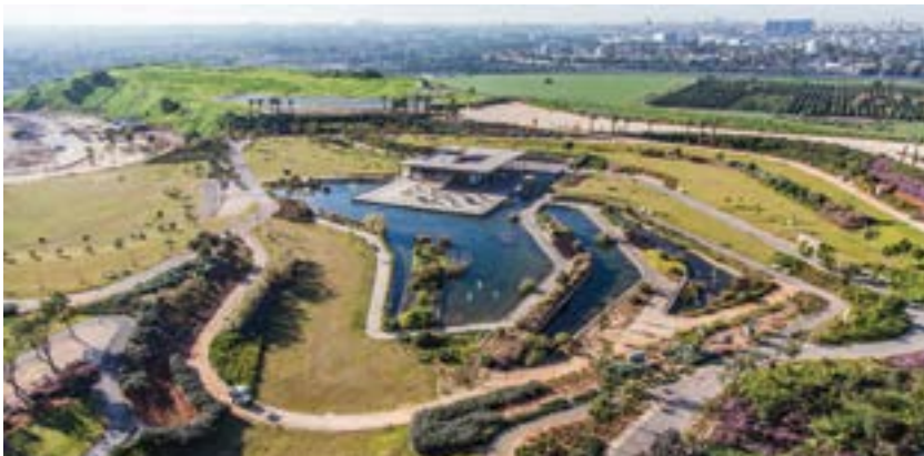
פארק אריאל שרון. מהר של זבל לפארק מטרופוליני.

כניעת ראשי מערכת ניהול המקרקעין לאנשי העסקים, המתאווים לגרוף תשואה נכבדה ממיזם הנדל"ן בטבורו של הפארק, הציתה מאבק איתנים של ארגוני הסביבה לביטול מיזם הנדל"ן בלב הפארק.