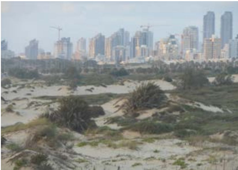
פיתוח אשדוד מאיים על החולות.

בנוסף לכך, התאוותה כל אחת מארבע הרשויות המקומיות להקים כפר נופש חופי במרחב המצומצם, וגם משרד התיירות חמד את השטח ותכנן להקים "ריביירה" של מלונות לכל אורך החוף בין אשדוד לאשקלון. בשל התנגדותה הנחרצת לתוכנית, הגדיר שר התיירות דאז עוזי ברעם את החברה להגנת הטבע כ"ריחיים על צווארי פיתוח התיירות".