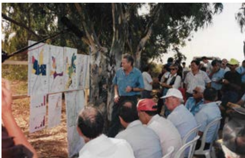
ביקור ראש הממשלה יצחק רבין בפארק השרון, 1993.

כישלון זה של הממשל לממש את החלטותיו והבטחותיו, והסירוב של מינהל מקרקעי ישראל לפדות את הקרקע בפארק מבעלי הזכויות החקלאיות בו, היו בין הגורמים שהובילו אותי לפעול במטרה להטיל על רשות מקרקעי ישראל את החובה לשמור על השטחים הפתוחים ולממן זאת. כפי שיתואר בהמשך, מטרה זו הושגה לאחר מאבק ממושך, כאשר באוגוסט 2009 נענתה כנסת ישראל לפנייתנו וכללה את החובה של רשות מקרקעי ישראל לשמור על השטחים הפתוחים בחוק מינהל מקרקעי ישראל (ואף כללה בתיקון לחוק את הקמת הקרן לשמירה על השטחים הפתוחים, שמקור מימונה הוא אחוז שנתי מהכנסות המדינה מפיתוח הקרקע).