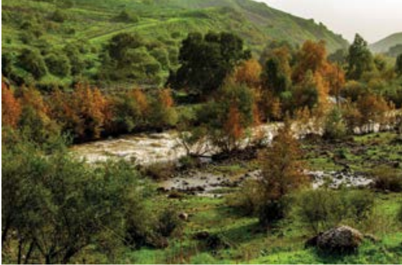
הירדן ההררי.

והצמחים הזקוקים למימיו ההולכים ומצטמצמים, נועד, בשל אופיו וייחודו, לקבל מעמד של שמורת טבע.