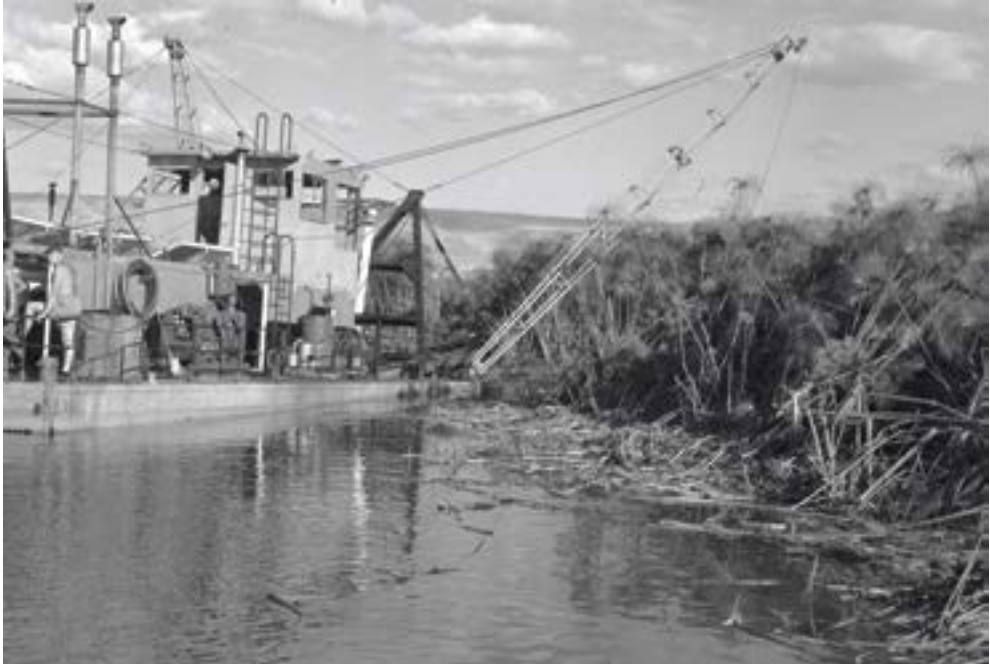
ייבוש החולה, 1955.

המקורית, שכמה מנציגיו נכחדו לבלי שוב. ואולם, יש לראות סמל של שינוי חיובי שהתחולל ביחס לטבע ולשמירתו, בעצם הוויתור על חזון ייבוש הביצות, במהלכים שנעשו להחלפתו בשיקום הביצות, ובנכונות של הממסד לראות במושג ביצה, שהייתה מילה נרדפת לאיום, ניוול ושליה – ישות בעלת ערך ויופי.