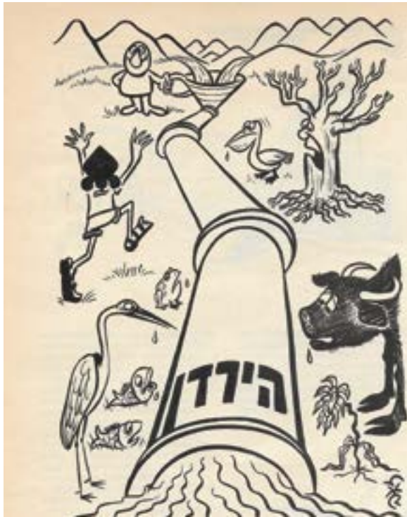
הצלת מעיין הדן. ציור של זאב, במלאות שלושים לחברה להגנת הטבע. "טבע וארץ"