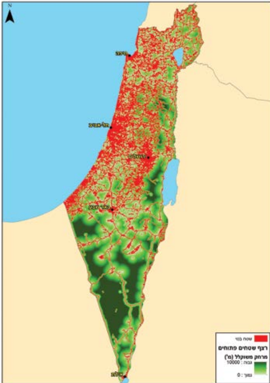
מצוקת השטחים הפתוחים בישראל: בחלק המיושב של הארץ - מרחק השטחים הפתוחים מבינוי אינו עולה על חמישה קילומטרים.