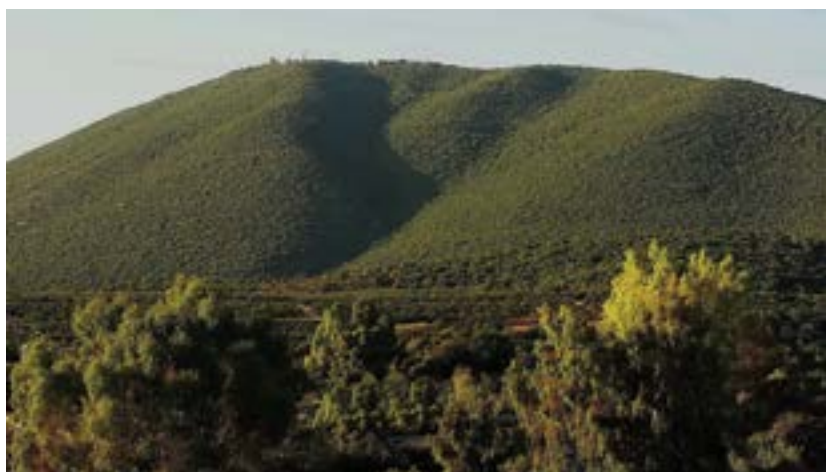
הר מירון.

למרבה הצער, הפעם הסתיים המאבק הזה בכישלון. העתירה הסתיימה אמנם בהסכם פשרה בין כל המעורבים, שקיבל מעמד של פסיקת בג"ץ, אך הדרך נפרצה בלב השמורה, לנוכח אוזלת ידו של השלטון לאכוף את החוק.