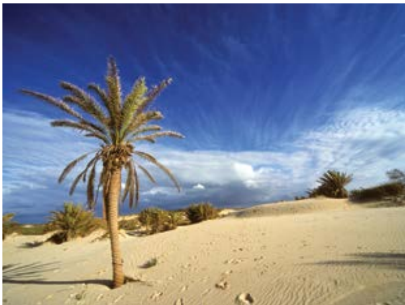
חולות ניצנים.