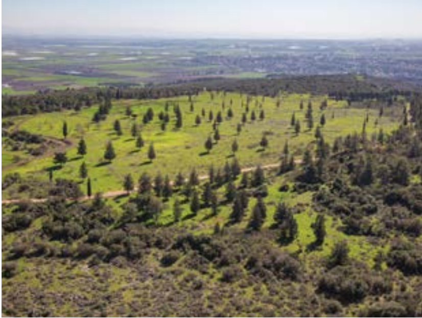
רמת הנדיב.

רמת הנדיב לדגם ליישום גישות תכנון וניהול בשטחים פתוחים אחרים ברחבי המדינה ואף מחוץ לישראל.