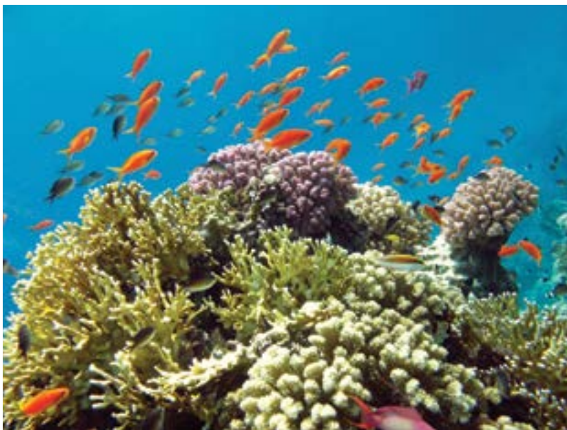
שמורת טבע חוף האלמוגים באילת.