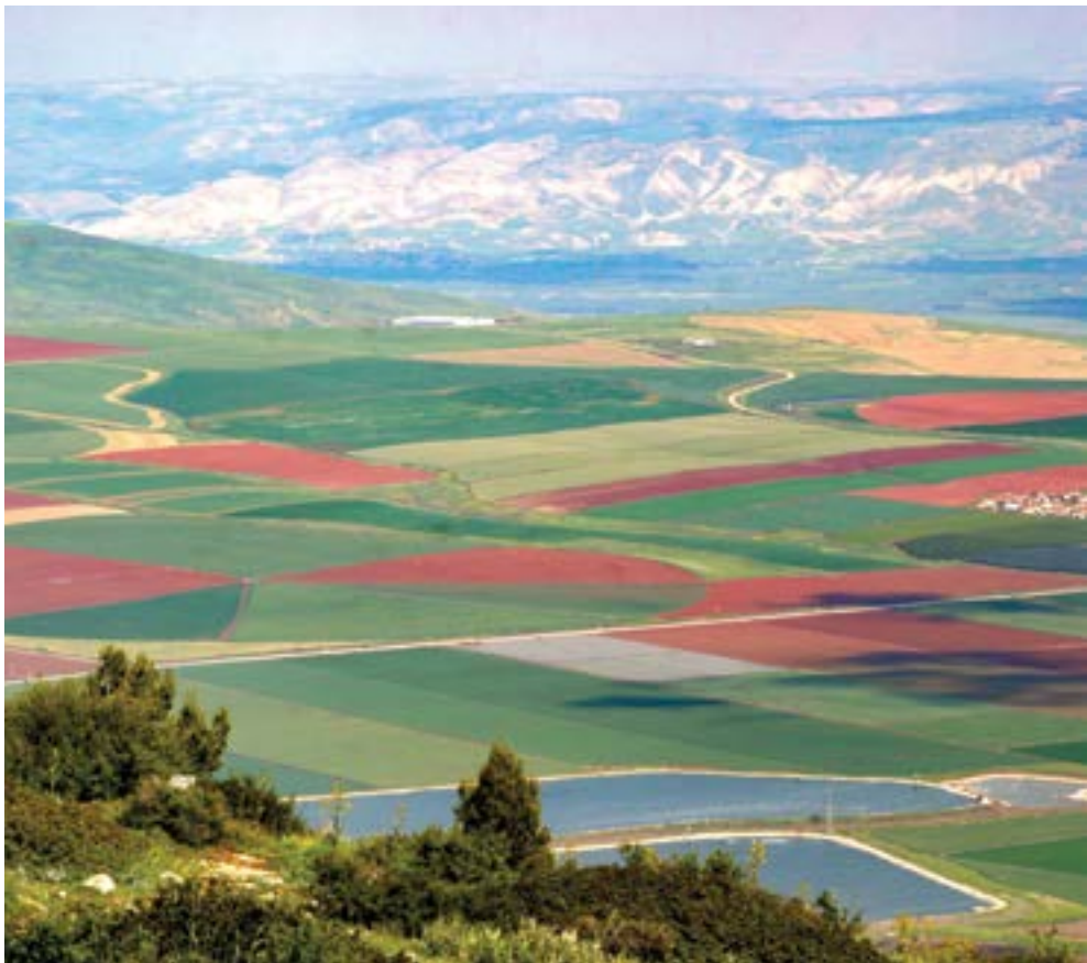
תצפית מהגלבוע.

ואם יסייעו מקצת מהדברים שהועלו בספר זה להמשך הדרך וחיזוקה, הרי שיהיה בכך שכר לעמלי.