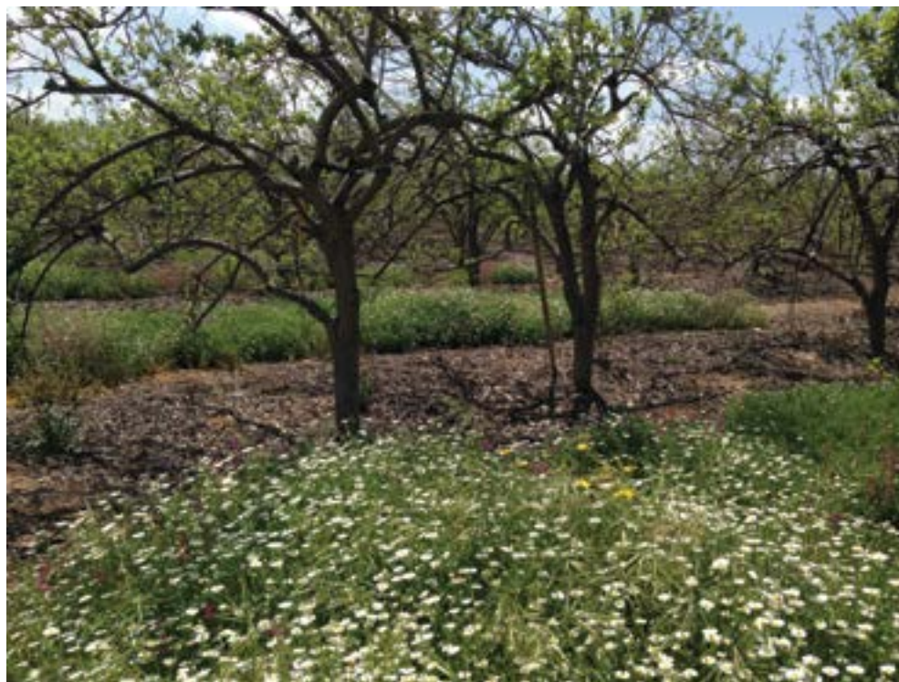
מיזם חקלאות תומכת סביבה במועצה אזורית לב השרון: פרחי בר משולבים בפרדס צעיר למשיכת מאביקים טבעיים.

בממשלות הבאות כיהנו שרי חקלאות שענייניהם התמקדו יותר באג'נדה הפוליטית שלהם מאשר בחקלאות, והם עצרו את המימון לפרויקטים נוספים. רק בשנת 2017 הוקצה מימון להמשך המיזם בעמק חפר ולשלושה פרויקטים נוספים – במועצות האזוריות רמת נגב, מגידו ומושבות השרון – אך אין זה אלא בגדר הקומץ שאינו יכול להשביע את הארץ.