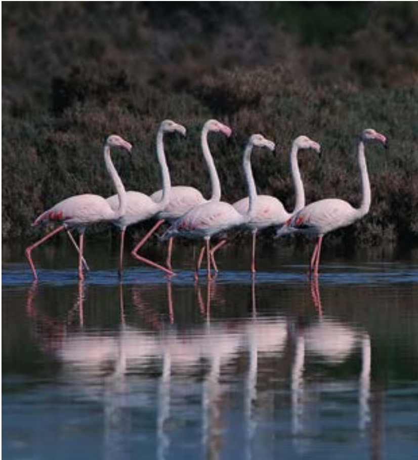
קשיטנים (פלמינגו) בבריכות המלח בעתלית.

בין המינהל לקבוצת דנקנר. ההסכם החדש הוגש לאישור היועץ המשפטי לממשלה אז, אליקים רובינשטיין, וזה מתח עליו ביקורת. אלא שהסתייגות היועץ המשפטי מההסכם ואף התנגדותה הנחרצת של קק"ל לא הפריעו לשר אהוד אולמרט ולמועצת מקרקעי ישראל בראשותו לאשר את ההסכם.