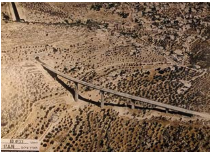
כביש המנהרות באזור נחל גילה והר גילה.