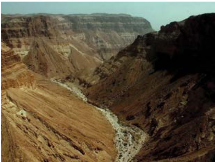
נחל חבר.

ונדירות. חיים בה יעלים, נמרים, עופות וצמחים נדירים, והיא מגלמת באופייה הטבעי ובממצאים ההיסטוריים שבה ערכים ייחודיים המספרים את מורשת התרבות של הארץ (כמו אותו סיפור הסתרתו של דוד בן ישי במדבר כדי להתגונן מפני שאול המלך שביקש להורגו). במצוקי נחל חבר מצויה גם מערת האיגרות שהסתתרו בה אנשי עין גדי מפני הרומאים בשלהי מרד בר כוכבא. האיגרות ויתר הממצאים הארכיאולוגיים שנמצאו במערה חשפו פרטים מדהימים ורבי חשיבות על התנהלות המרד ועל אורח החיים בתקופה ההיא. ברור היה שכל בינוי ופיתוח ופעילות מלונאית אינם יכולים להשתלב בנוף ובמערכות הטבעיות הללו.