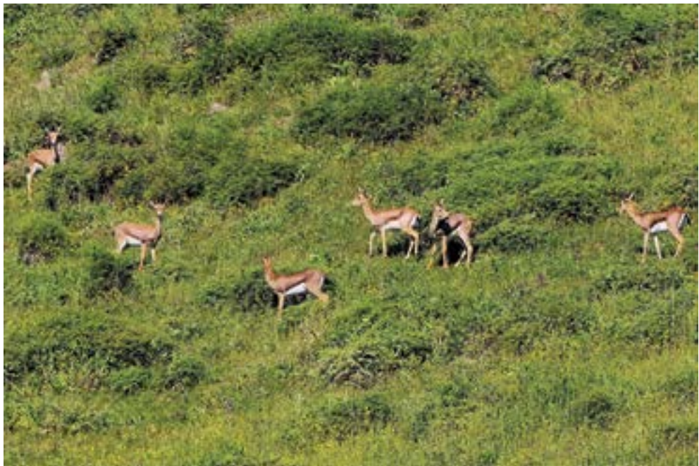
צבאים ברמת יששכר.