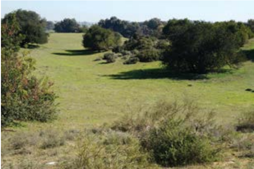
פארק השרון.

בשלב כלשהו של הדיונים בתוכנית, היה מי שהעלה את הרעיון לבחון את השווי הכלכלי של הגן הלאומי אל מול ערכו הכלכלי של הכביש שתוכנן לחצותו. מאחר שידענו שאין דרך מהימנה לאמוד את ערכו של הפארק במונחים כספיים, ושכל ערך שיוצג כתוצאה מבדיקה כזו לא יצדיק את הריסתו, הצענו, במקום זאת, לבצע אומדן כלכלי שיעריך את עלות חלופת האפס , כלומר, את הנזק שייגרם למשק אם לא תבוצע סלילת הכביש ותחת זאת ישודרגו כבישי הרוחב המחברים בין כביש 2 וכביש 4 העוברים מצפון ומדרום לפארק. בסופו של דבר לא בוצעה בדיקה זו, אך בעקבות הדיון בה ובהצעת קבלת חלופת האפס, לא אושרה התוכנית לסלילת הכביש.