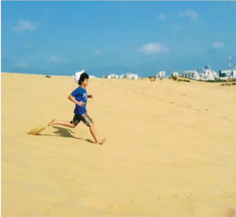
ניצחון החול.