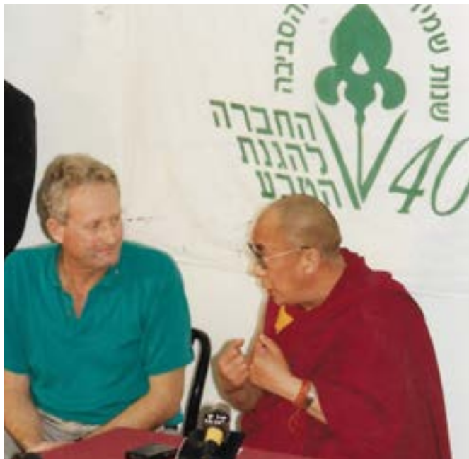
הדלאי לאמה (עם מחבר הספר) בכנס הבינלאומי באילת, 1994.

ב-1994 קיימנו, במסגרת ציון שנת הארבעים לפעילות החברה להגנת הטבע, כנס בינלאומי רחב בנושא תרומת הארגונים הלא ממשלתיים לשמירת הטבע והסביבה. בכנס, שהתקיים באילת בחסות השר לאיכות הסביבה יוסי שריד, השתתפו יותר ממאה ראשי ארגונים לא ממשלתיים (NGO) לשמירת טבע מרחבי העולם. אורח הכבוד של הכנס היה הדלאי לאמה בכבודו, שערך אז את ביקורו היחיד בישראל.