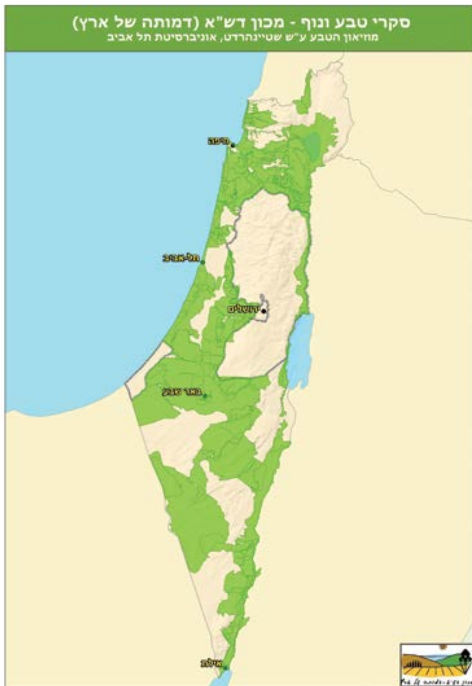
סקרי טבע ונוף שבוצעו על ידי מכון דש"א ב-1985-2020