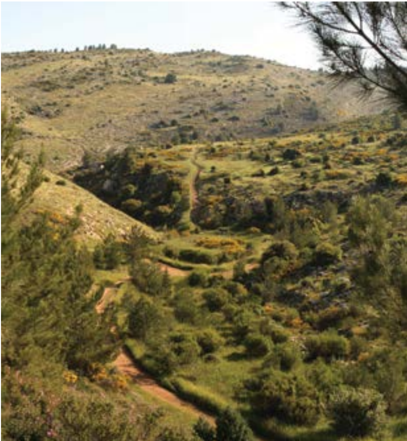
נחל יתלה.

מסילת הרכבת תוכננה לעבור במנהרה בכל המרחב, ודווקא בקטע הרגיש ביותר, בראש הקניון של נחל יתלה , תוכננה יציאה של המסילה מההר והעברתה בגשר מעל לנחל.