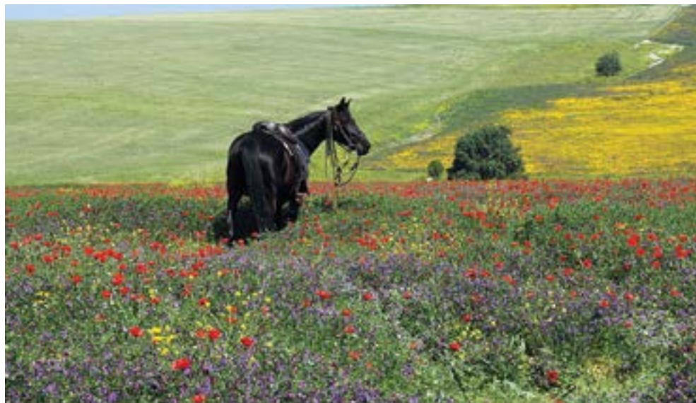
מרחב ביוספרי מגידו.

לאחרונה החל מינהל התכנון בהכנת מדריך להקמת מרחבים ביוספריים, במטרה לסייע בהקמה של מרחבים נוספים כאלה באזורים אחרים בארץ.