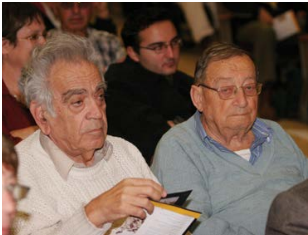
אמוץ זהבי ועזריה אלון, זוכי פרס ישראל לשנת 1981 ביחד עם החברה להגנת הטבע.

כל אחד מעובדי החברה בתקופה ההיא פעל באזור מסוים בארץ כמעין פקח. בהיעדר חוק שמירת טבע, נעשתה פעילותם של עובדי החברה להגנת הטבע ללא סמכויות אך באמצעות היכרות טובה של כל עובד עם האזור "שלו" ועם המתרחש בו.