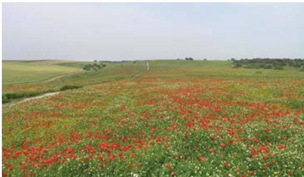
מגוון נוף.

המונח על פי התפיסה המוצגת בספר זה, מתייחס, אם כן, לכלל התופעות היוצרות את חזות הארץ ומרכיביה: התנאים הפיזיים הנגזרים מהתופעות הגיאולוגיות והגיאוגרפיות שעיצבו את פני השטח, המגוון הביולוגי והמערכות הטבעיות שהתפתחו על בסיס התנאים הפיזיים והאקלימיים, המורשת התרבותית האנושית שהתפתחה במהלך ההיסטוריה וטבועה בנוף. מגוון הנוף מספק לנו, לציבור, שירותים חיוניים לרווחתנו ולבריאותנו הפיזית, החברתית והנפשית. ניתן לדמות את הארץ כולה למעין פסיפס של ”יחידות נוף” – שכל אחת מהן מצטיינת במגוון משל עצמה, בעל תכונות אופייניות וייחודיות. כל יחידת נוף מהווה אבן אחת בפסיפס מגוון הנוף הכולל שיוצר את דמות נוף הארץ.