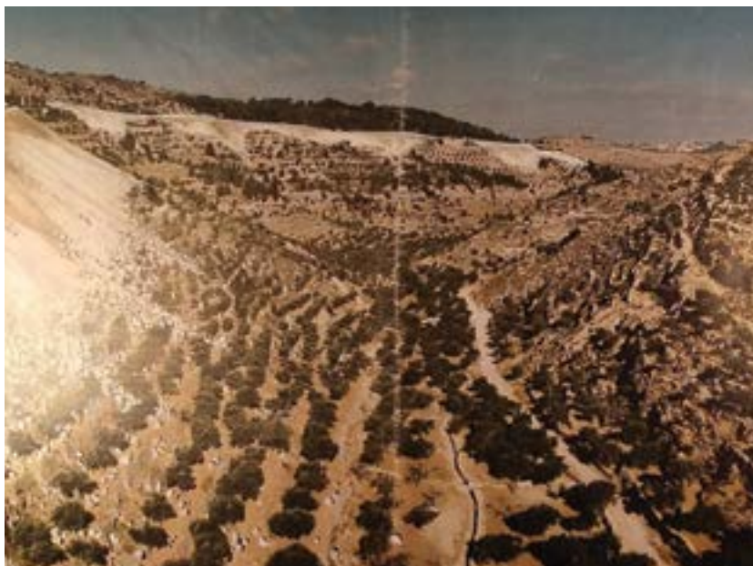
נחל גילה - הדמיית הפגיעה של תוכנית הכביש המקורית. איור: עמיר בלבן