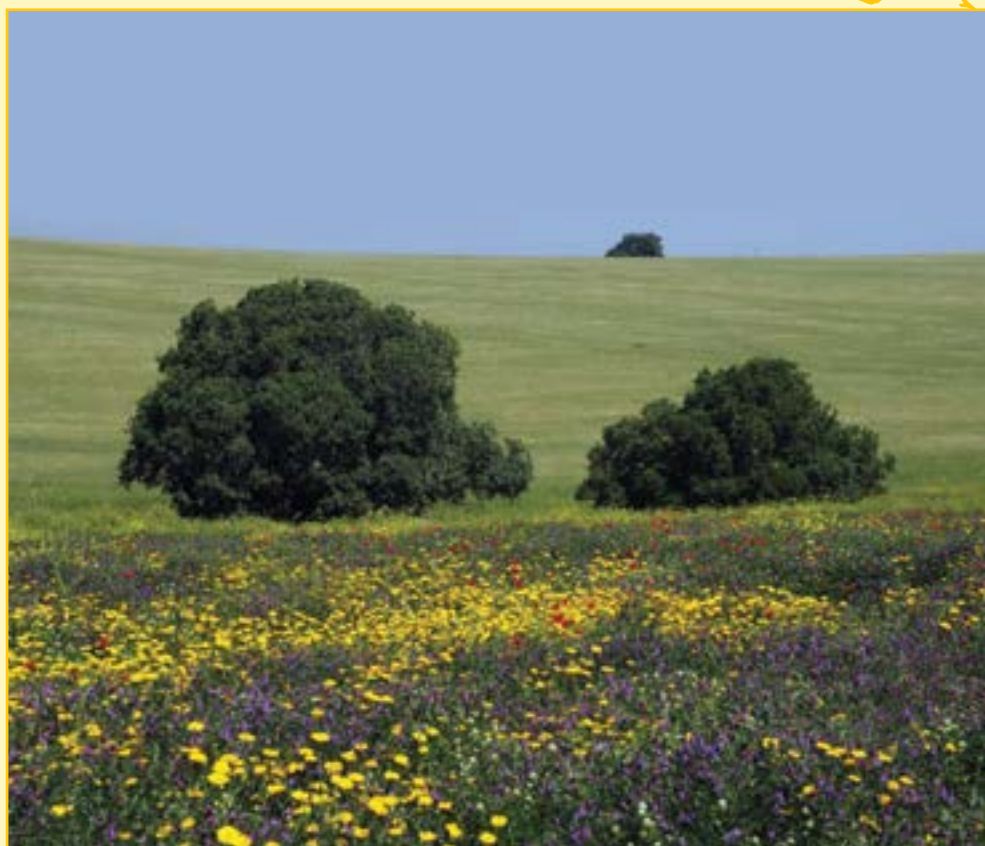
עמק השלום, רמת מנשה.

המהפך – מ"כיבוש הקרקע" לשמירה על הטבע והנוף בכל השטחים הפתוחים