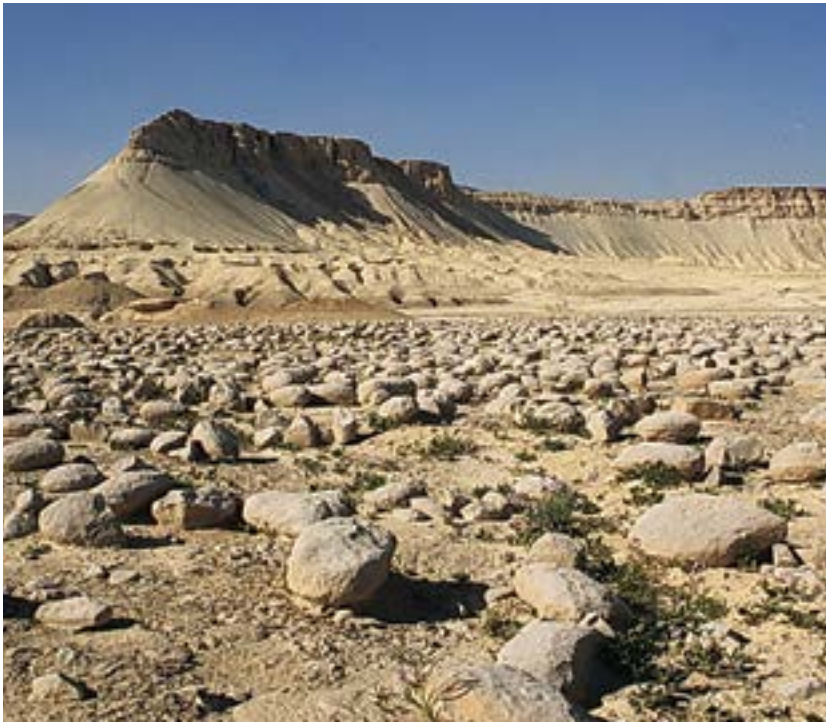
הר צין (הור ההר) ושדה הבולבוסים.

הר צין הוא הר שולחן המתנשא לתפארה מעל בקעת צין. שולחן סלע הגיר הקשה שבראשו מוקף במדרונות חוואר תלולים ומחורצים העוטפים אותו כגלימת טוגה יוונית יפהפייה, ואל שוליהם הדרומיים צמוד "שדה הבולבוסים" – מישור שעליו פרושים אלפי בולבוסים סלע ענקיים. זוהי תופעת טבע יפה ומרשימה, שעד היום מתוכחים הגיאולוגים על פשר היווצרותה.