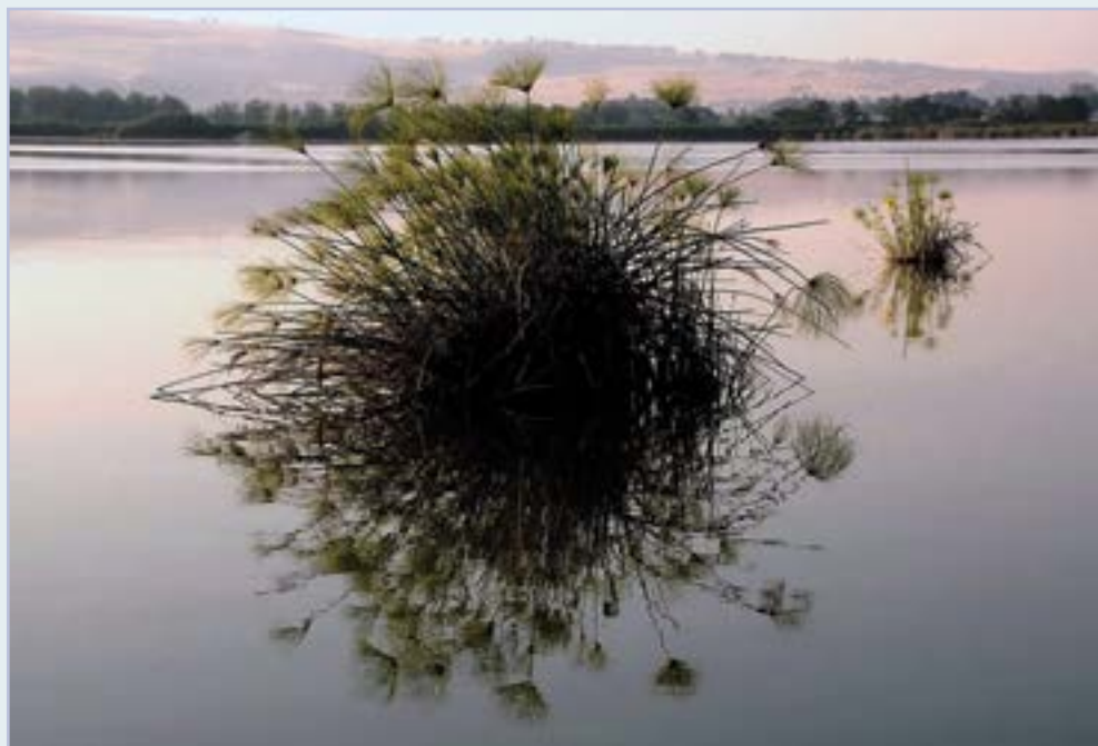
שמורת החולה - שמורת הטבע הראשונה שהוקמה בישראל.