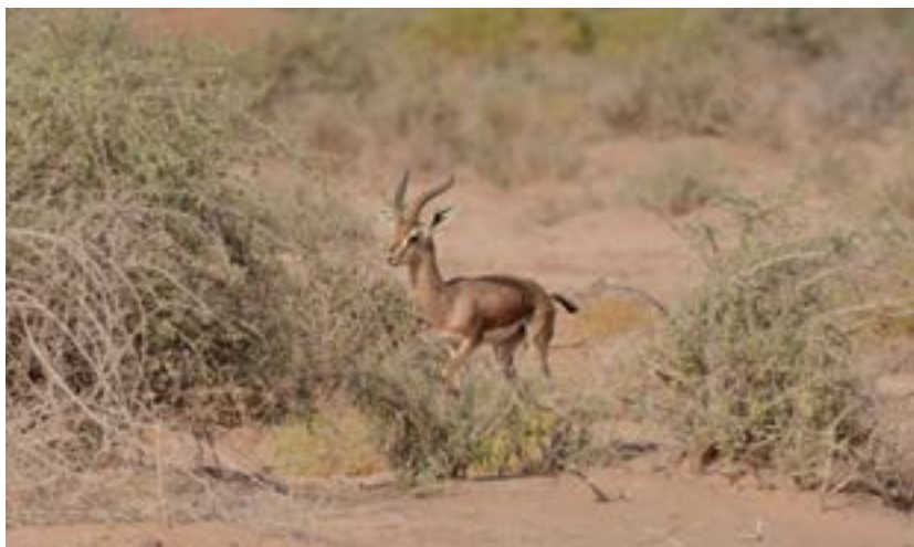
צבי בלב הערבה.