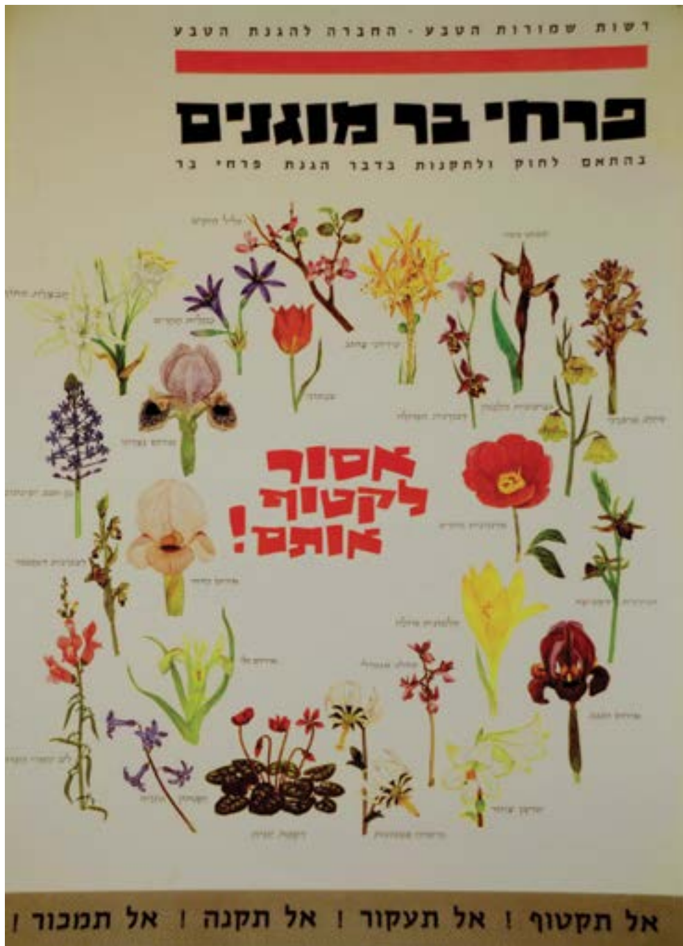
הכרזה הראשונה של פרחי הבר המוגנים.