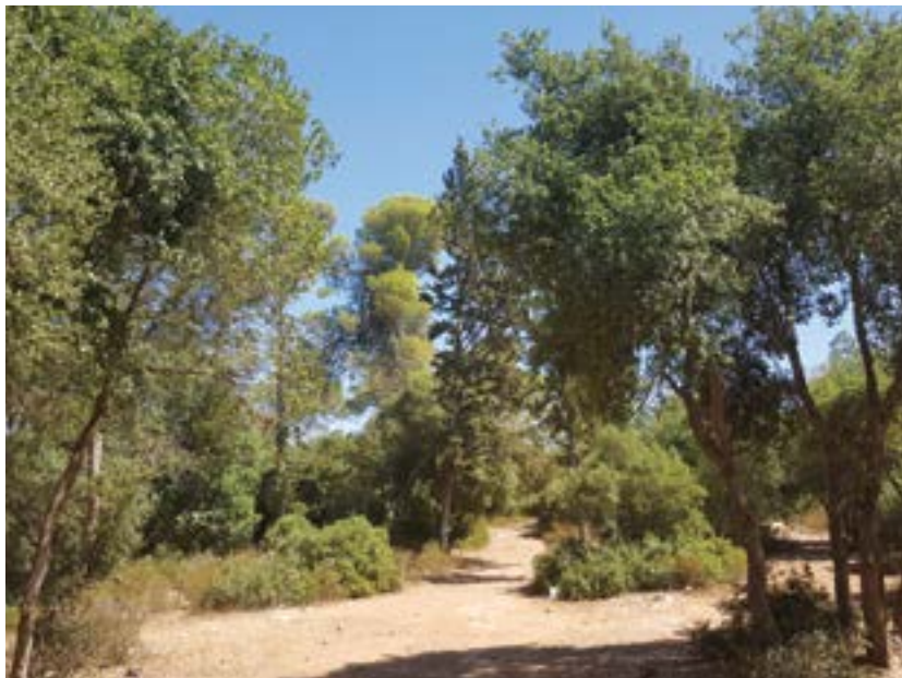
יער אום צפא.

כדי לא להיגרר אל לב הסערה הפוליטית, ולהבהיר שאין במאבק משום נקיטת עמדה פוליטית, היה על החברה למצוא את הדרך להתנהל בין סערות הגשם הפוליטי מכאן ומכאן בלי להירטב.