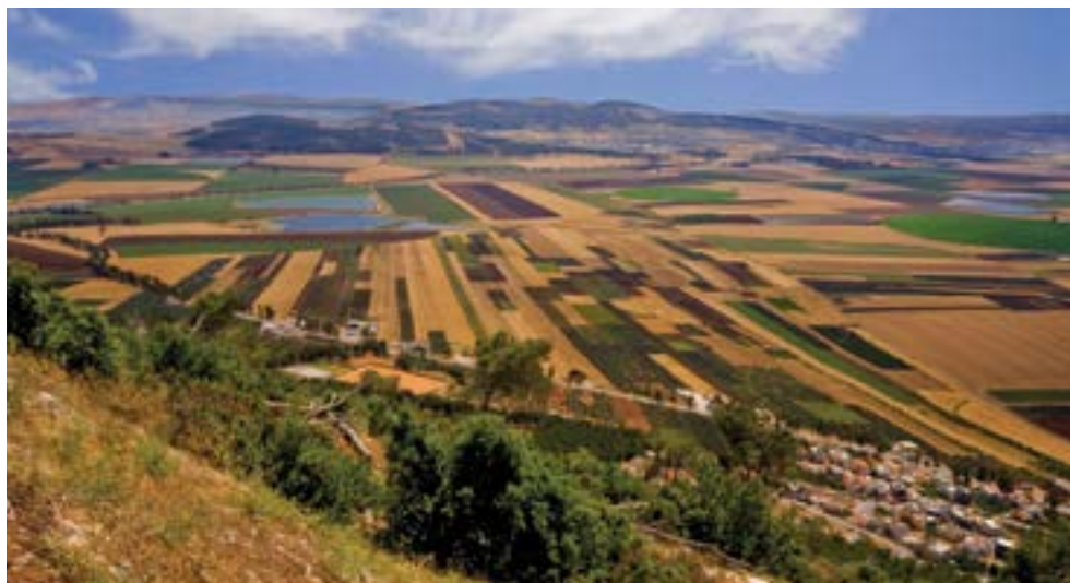
בקעת כסולות, מבט מהתבור.

הזירה השלישית שבה פעל מכון דש"א לקידום הטמעת השינוי בתפיסת השטחים הפתוחים בישראל, שהצטרפה לזירות התכנון וניהול המקרקעין, היא זירת המגזר החקלאי והכפרי, והמועצות האזוריות ששטחי החקלאות והכפר מצויים בתחומיהן.