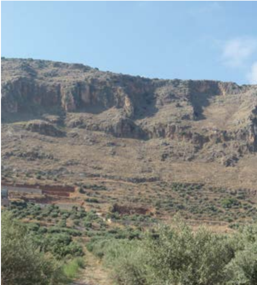
מתלול צורים.